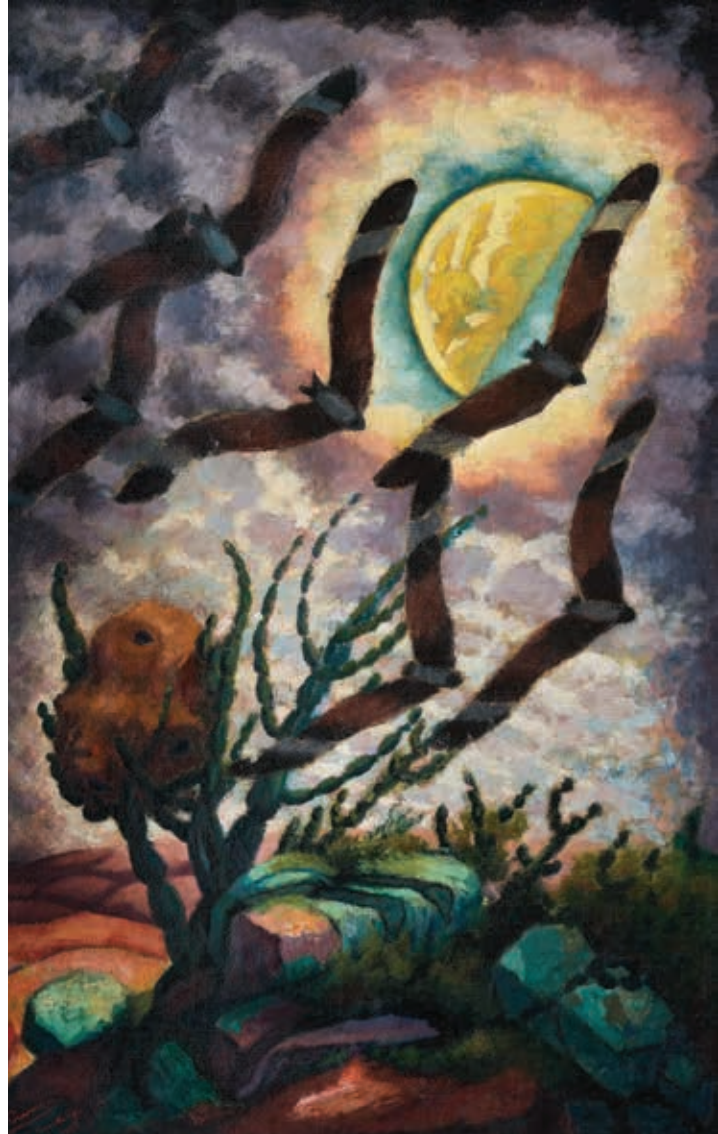
José Cúneo "Luna y enramada"