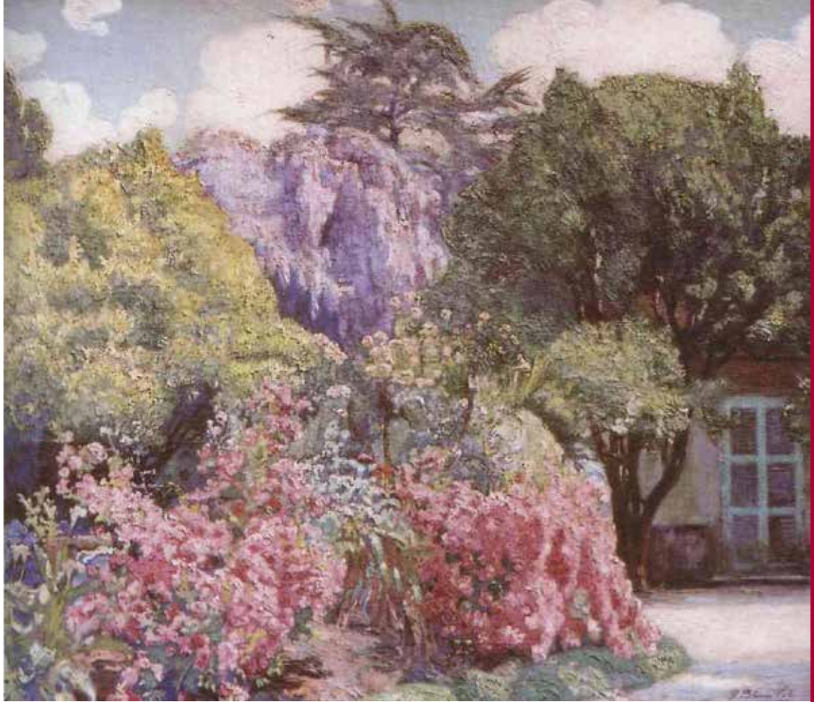
Pedro Blanes Viale "Jardín, Quinta de Castro"