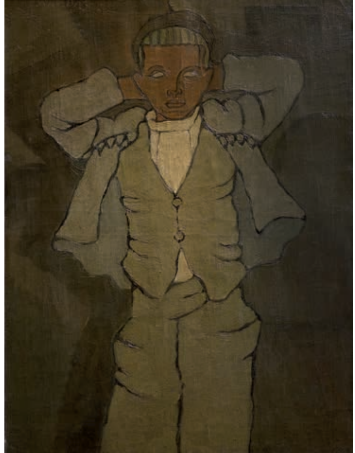
Rafael Barradas "Calixto - mi sobrino Calixto"