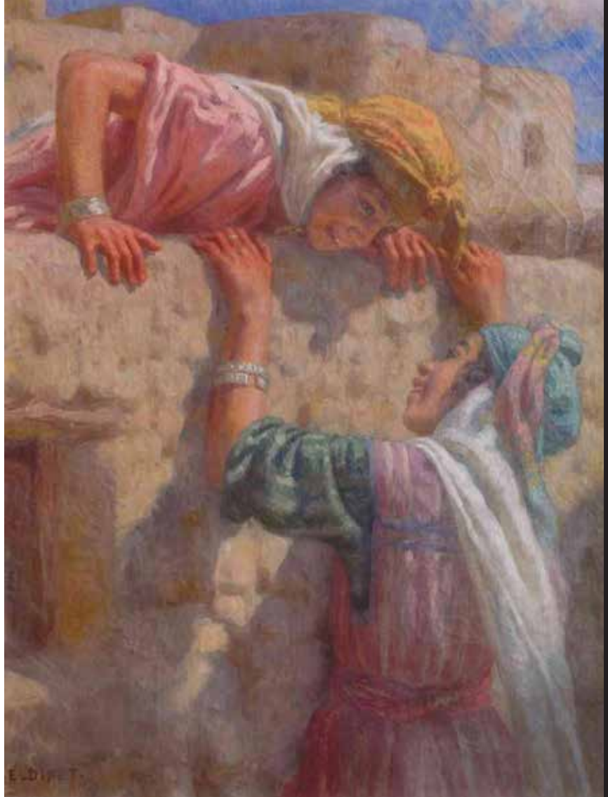
Etienne Alphonse Dinet "Pequeñas vecinas"