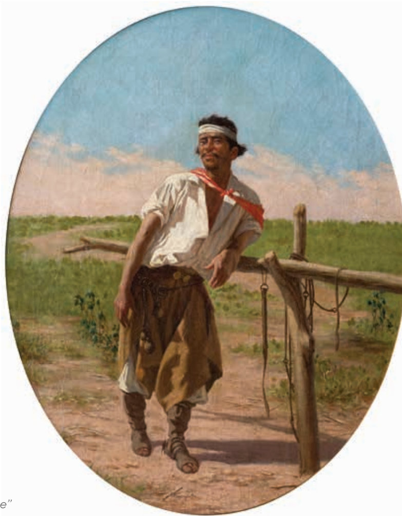
Juan Manuel Blanes "Gaucho en el palenque"